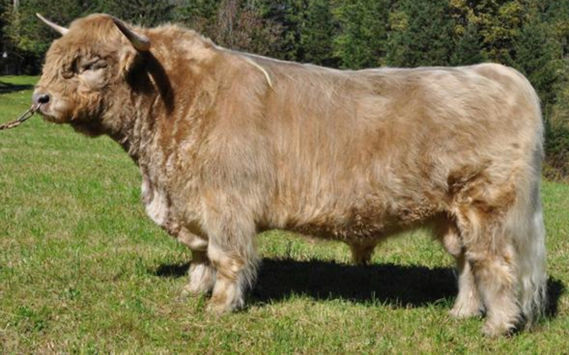
Růstové standardy plemene HI