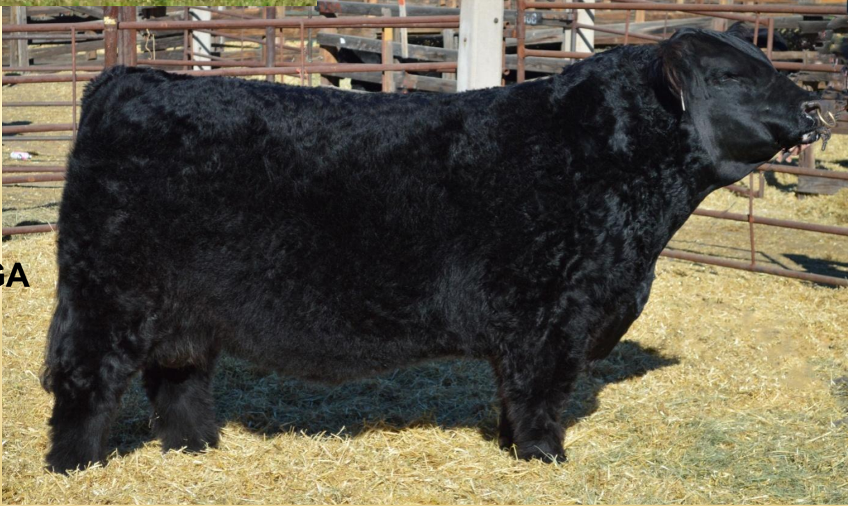
Růstové standardy plemene GA